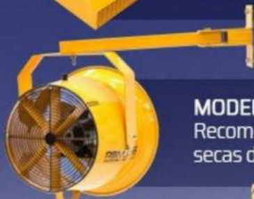
MODELO R-DF-18 Recomendado para cajas secas de hasta 53 ft.