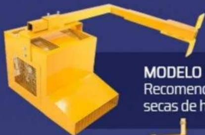
MODELO RTC Recomendado para cajas secas de hasta 53 ft.