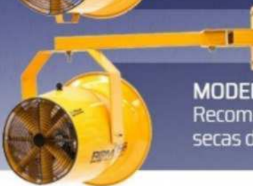
MODELO R-DF-14 Recomendado para cajas secas de hasta 26 ft.